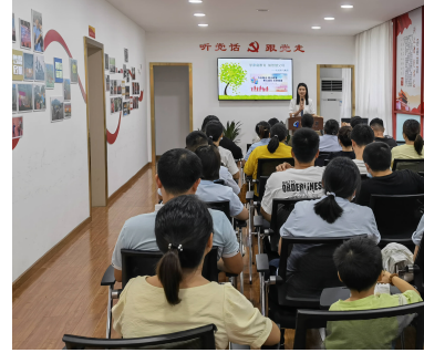
本报(魏丽莉)教育一直是每个家庭、每位父母最为关心的问题。8月21日,在丽汽集团工会和妇联携

手精心组织下,《智慧父母》课堂首期开课。课堂以家庭教育做智慧父母》走进丽汽集团,为集团公司工会会员和女工献上了一堂精彩的家庭教育课程。 “家庭是孩子第一所学校、父母是孩子第一任老师”已经成为现代教育中的一大理念和视野。